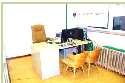
学院改造的教师办公室样板间