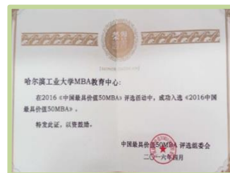
MBA 中心获“中国最具价值 50MBA”