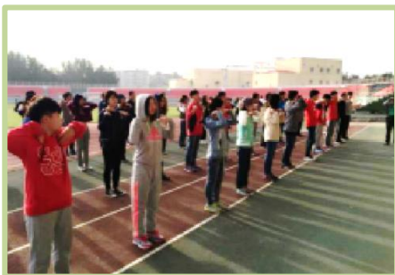
“四早一晨”习惯养成计划