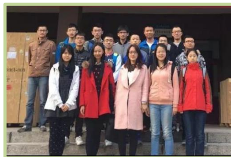
1410101 班获全国高校活力团支部称号