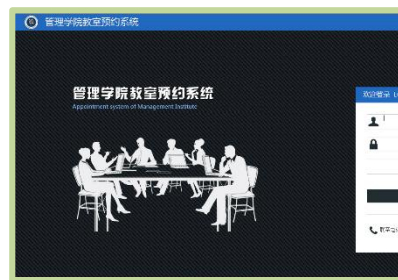
学院会议室预约系统上线试运行