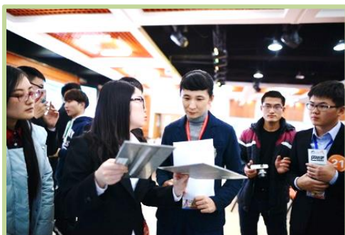
哈工大第四届创新创业大赛