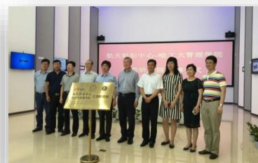
“航天科创—哈工大管理学院”江西研究院成立