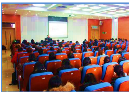
学习“十八届六中全会”