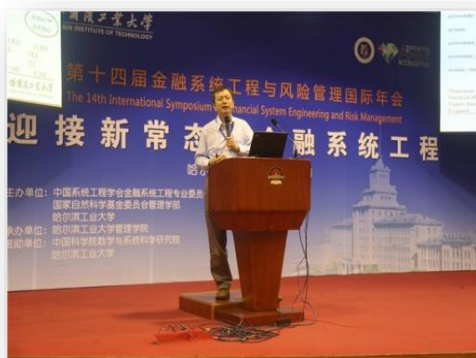
第十四届金融系统工程与风险管理国际学术会议