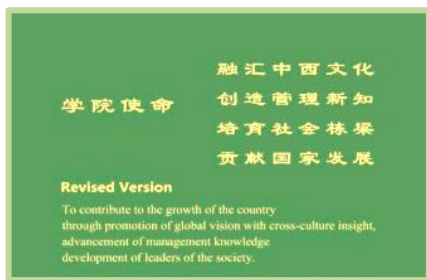
新修订的学院使命