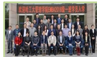
2016 年 EMBA 班入学合影