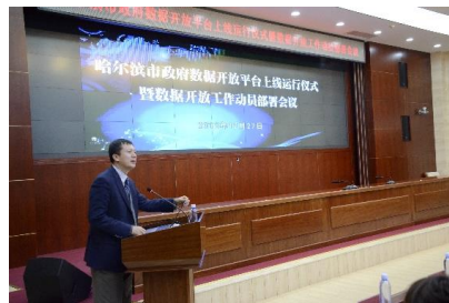
叶强教授出席哈尔滨市政府数据开放平台上线运行仪式