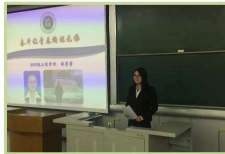
“青春·榜样”先进事迹报告会