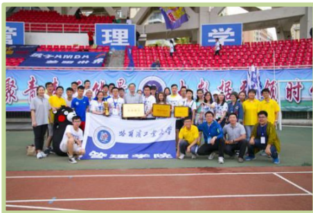
管理学院运动会工作人员合影