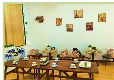
学院“七彩之家”职工小家