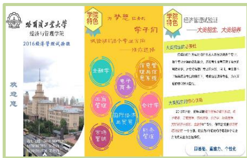
本科经管试验班微信宣传页（截图）