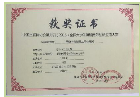
网络创新应用大赛特等奖获奖证书