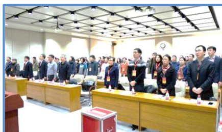
教代会暨职代会召开