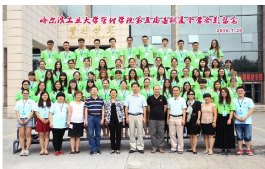
优秀大学生暑期夏令营