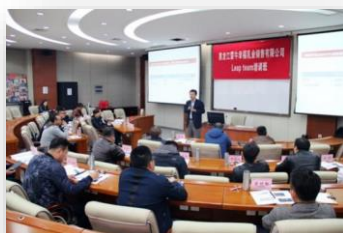
黑龙江蒙牛幸福乳业销售有限公司 Leap team 培训班