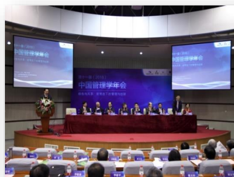
第十一届(2016)中国管理学年会