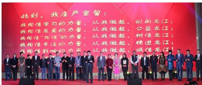
“树信龙江 你我担当”EMBA 校友年会